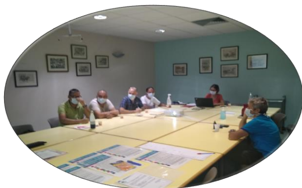
Réunion entre les brancardiers et la DSSI