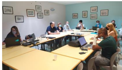
Rencontre avec les architectes

Ce jeudi 31 mars s'est tenue, en présence de la Direction Générale, la présentation de l'équipe de maîtrise d'œuvre pour le projet d'extension de la clinique. Cette rencontre était l'occasion d'officialiser le lancement du projet. Nous allons maintenant rentrer dans la phase de préparation du chantier, en grande partie consacrée aux démarches administratives et aux différentes études et diagnostics nécessaires à une telle opération. Le chantier proprement dit commencera début 2023, il sera divisé en 3 phases :